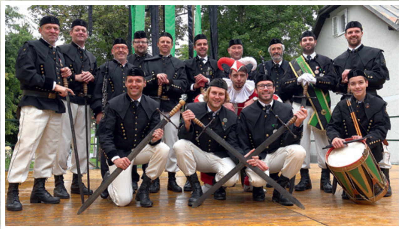
SCHWERTTANZGRUPPE BÖCKSTEIN 2017